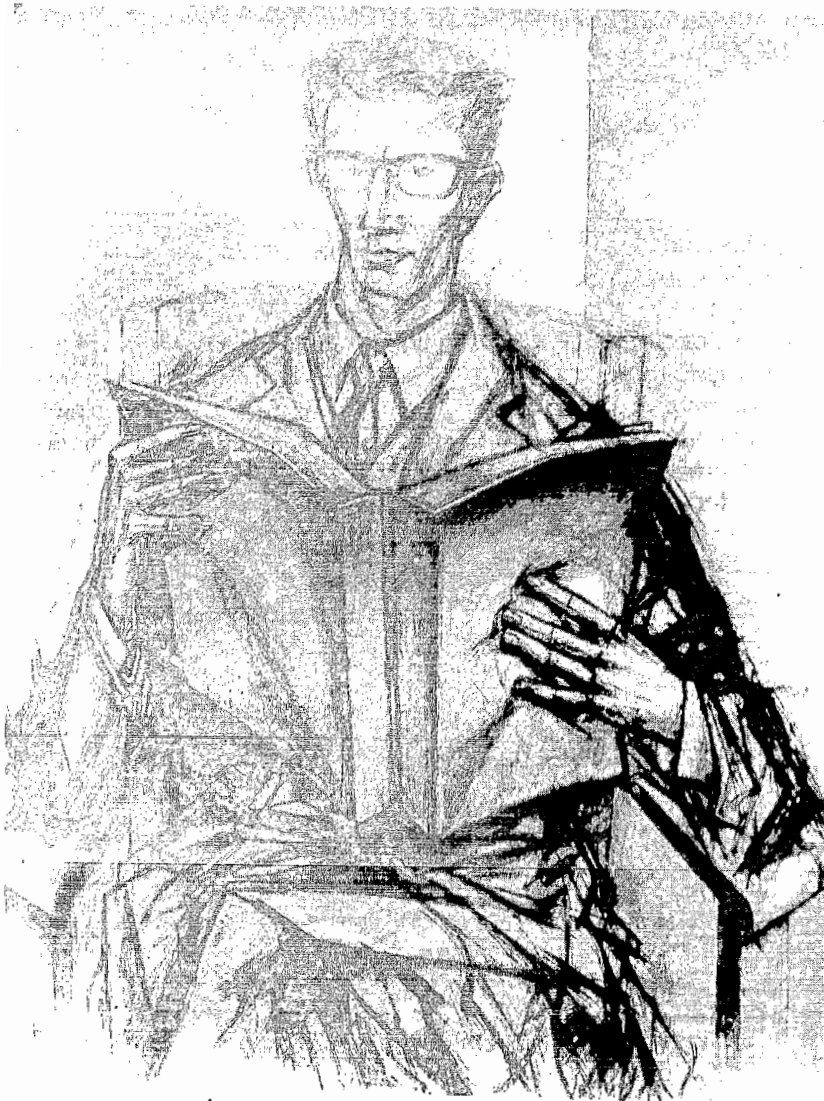
Reprodução fotográfica do desenho da autoria do Escultor Salvador Barata Feyo (Março de 1973)