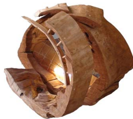
Interior, 2009 | madeira de castanho, resina de poliéster e néon | 80x90x80 cm (aprox.)

De 1996 a 2007 foi docente do departamento de Escultura da FBAUP.