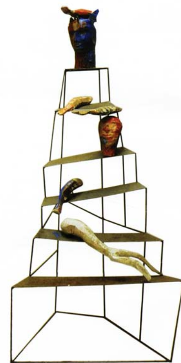
Difícil a pesca, 2009 | Ferro, madeira e acrílico | 200 x 100 x 110 cm (aprox.)

Os conhecimentos não são absorvidos apenas pela mente, pelo cérebro. Há uma sempre relação entre estes e o corpo, a postura do corpo. Quando se assimila algo novo o comportamento altera-se, os movimentos, o “ar”, o olhar... Porque conhecer não é apenas saber mais qualquer coisa. É torná-la parte do corpo e este, agir segundo essa aprendizagem, isso por vezes leva tempo mas haverá de ocupar o lugar dos hábitos anteriores. Essa transformação que se opera no indivíduo é que o torna diferente. As experiências, os saberes, as coisas acumulam-se como sedimentos do tempo não de forma regular e sequencial algumas vezes, mas sofrendo as distorções dos movimentos desse tempo. Ideias suspensas no tempo, algumas, porquê? – atropelam-se com prioridades várias. São anos de ressaca e de esperança se as ideias são fortes, com intenção. As procuras estéticas que pudessem fazer alguma diferença eram a tónica e os caminhos possíveis ramificavam-se. A repetição pode ser um estado de felicidade “ali”... Mas a repetição é por vezes uma “prisão feliz” e por isso a largo, embora possa sempre regressar a uma ideia que suspendi. Mas mesmo quando regresso é já carregado de outra história.