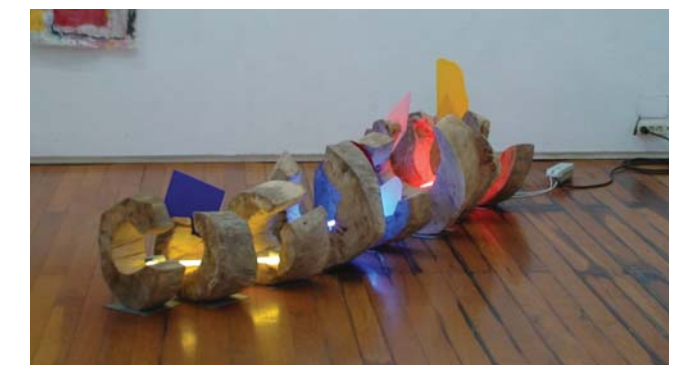
Sem título, 2009 | Madeira de choupo, chapa acrílica e néon Forma e dimensões variáveis | alt. 70 cm, comp. até 400 cm